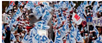
Ein riesiges Fahnenmeer veranstaltete die DSTG anlässlich des Neujahrsempfangs der nordrhein-westfälischen CDU im Januar 2007 in Düsseldorf.